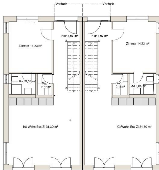
LEHR GRUNDRISS EG